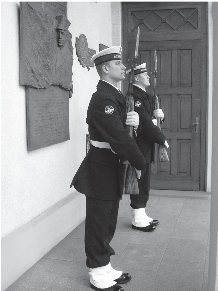
Puolalaiset merikadetit vartiassa Merivoimien esikunnan portilla.

roopan unionin mantereen itäsimppään pisteeseen rajaamalla itäpisteen katselupaikka rajavyöhykkeen ulkopuolelle. Samalla ulkopuolelle rajattiin itäpisteen lähellä oleva Luppotupa ja sinne johtava retkeilyreitti. Muutokset vähentävät rajavyöhykelupahallintoon sitoutunutta aikaa. Rajavyöhykemerkinnät maastoon tehdään vuoden 2010 alkuun mennessä.